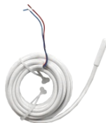
NTC 10kOhm bei 25oC